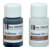
Art.-Nr.: je OF individuell Inhalt: 2 x 20 ml