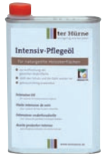
Art.-Nr.: 45559 Inhalt: 500 ml